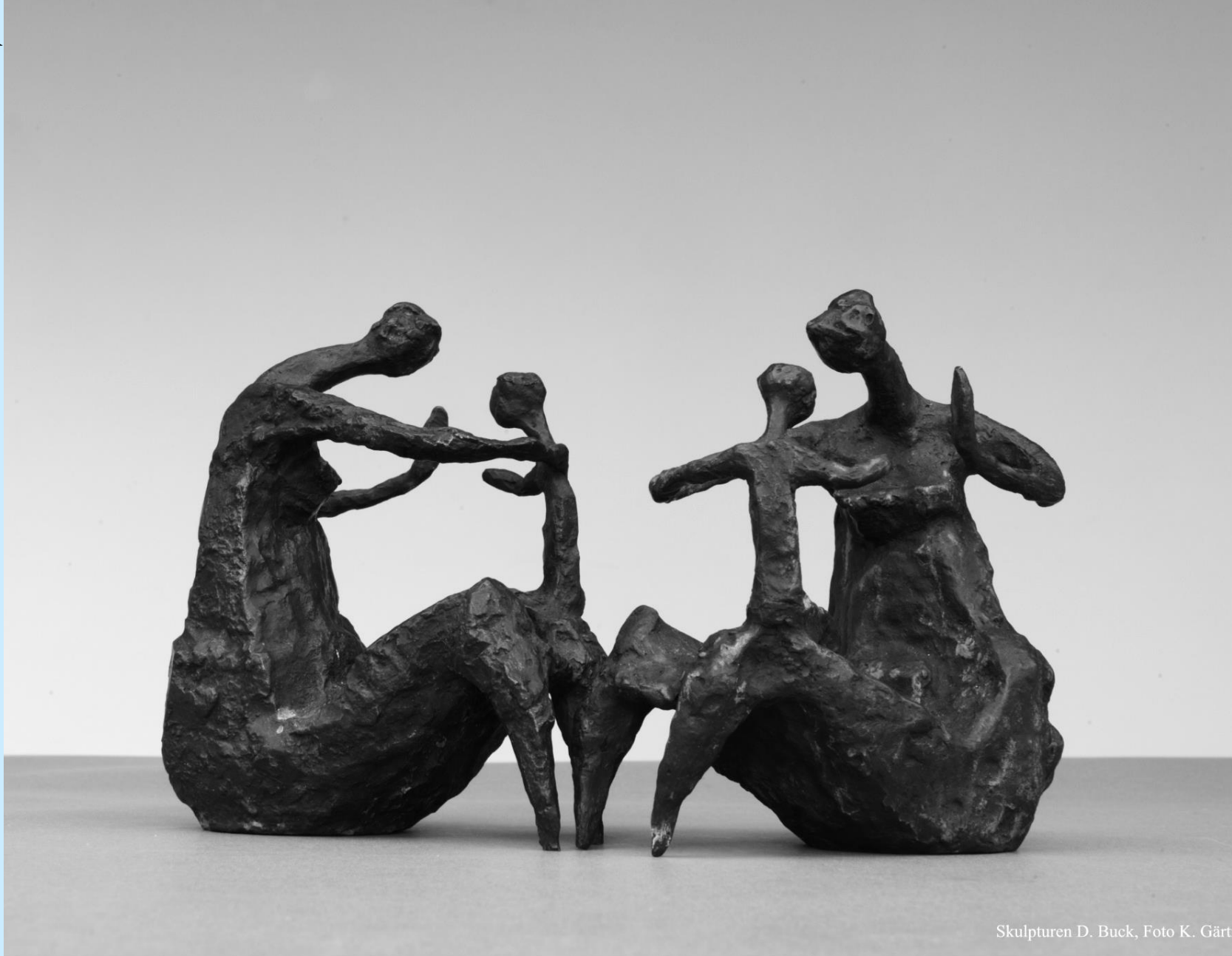
Skulpturen D. Buck