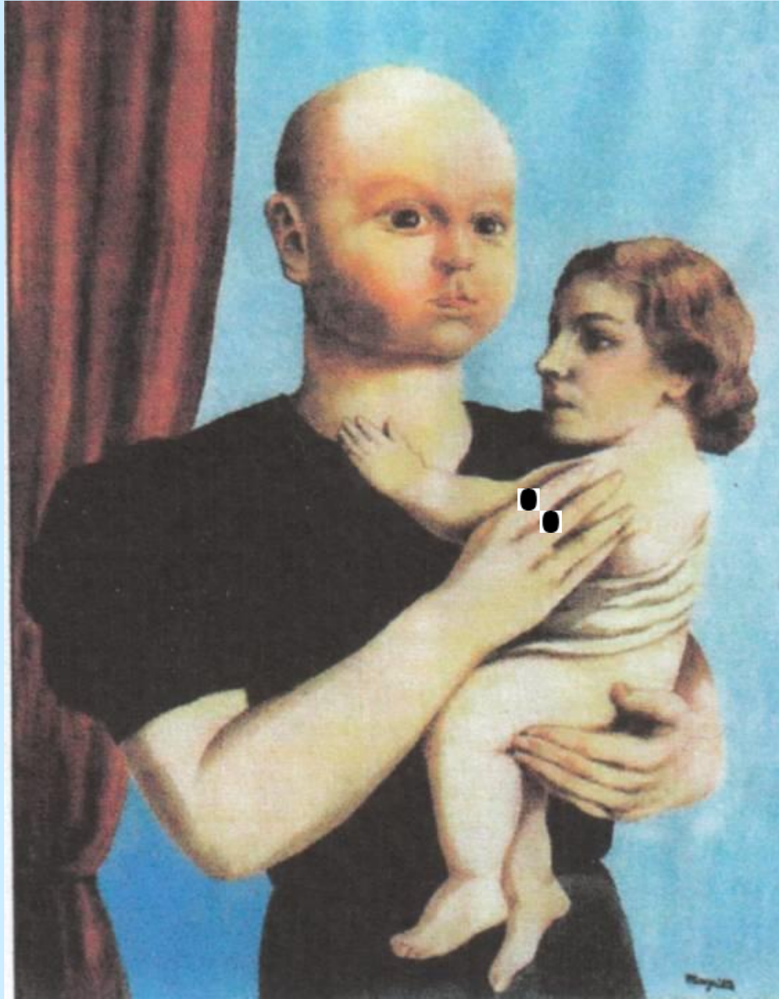
René Magritte Der Geist der Geometrie 1936/37