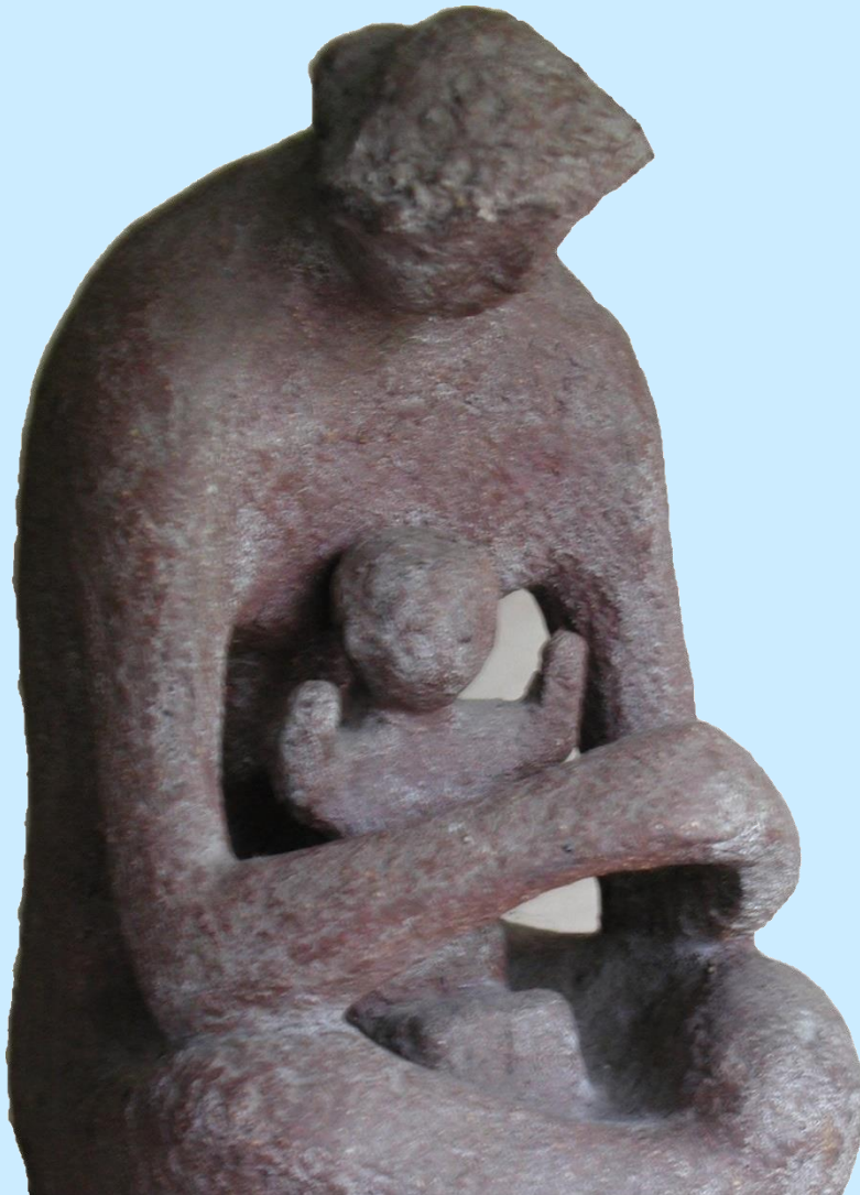
Skulptur: Dorothea Buck

„geborgen und sicher in deinen Armen...“